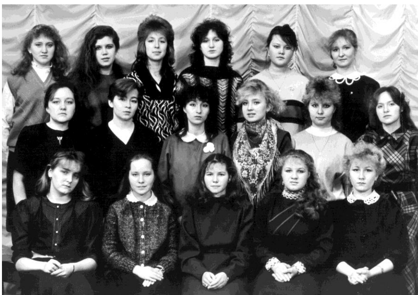
Выпуск 1991 г.

1992-1997 гг. Профессиональный и методологический рост преподавателей кафедры. Проведение методологических семинаров, поступление преподавателей кафедры в аспирантуру, публикация первых тезисов и статей. Успешное прохождение аттестации ВУЗа.