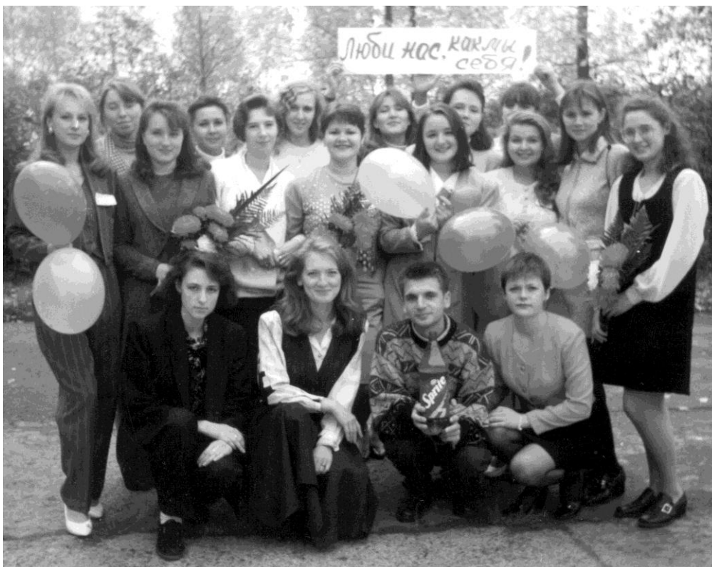
Выпуск 1999 г.

2002 - 2009 гг. – рост научно-исследовательской и личностной компетентности преподавателей кафедры. Участие в конференциях разного уровня. Защита диссертаций, получение званий доцента. Рост научных публикаций: монографий, статей, тезисов, а также учебно-методических пособий. Разработка УМК по специальности.