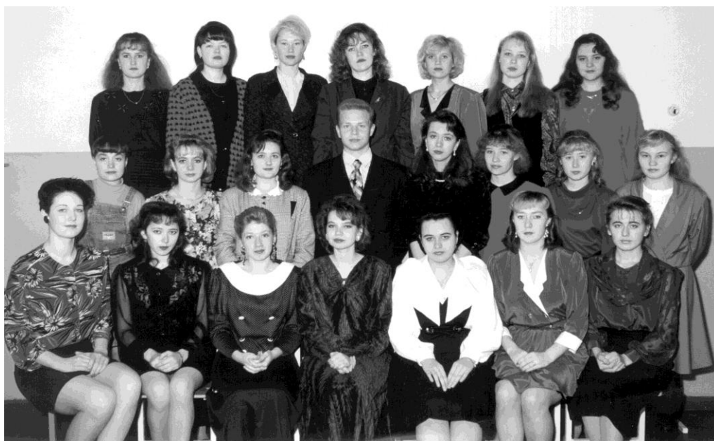
Выпуск 1997 г.

1997 – 2002 гг. – совершенствование профессиональной компетентности преподавателей кафедры. Проведение конференций по СОО, публикации статей, тезисов и выход первых учебно-методических пособий, налаживание связей с Управлением дошкольного образования, организация курсов повышения квалификации педагогов г. Глазова